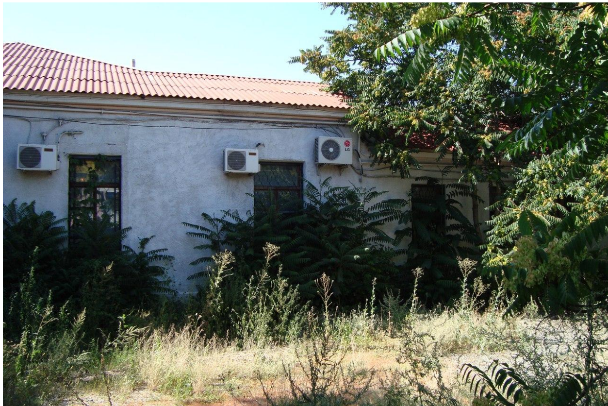
Фото 2. Фрагмент северного фасада со стороны двора.