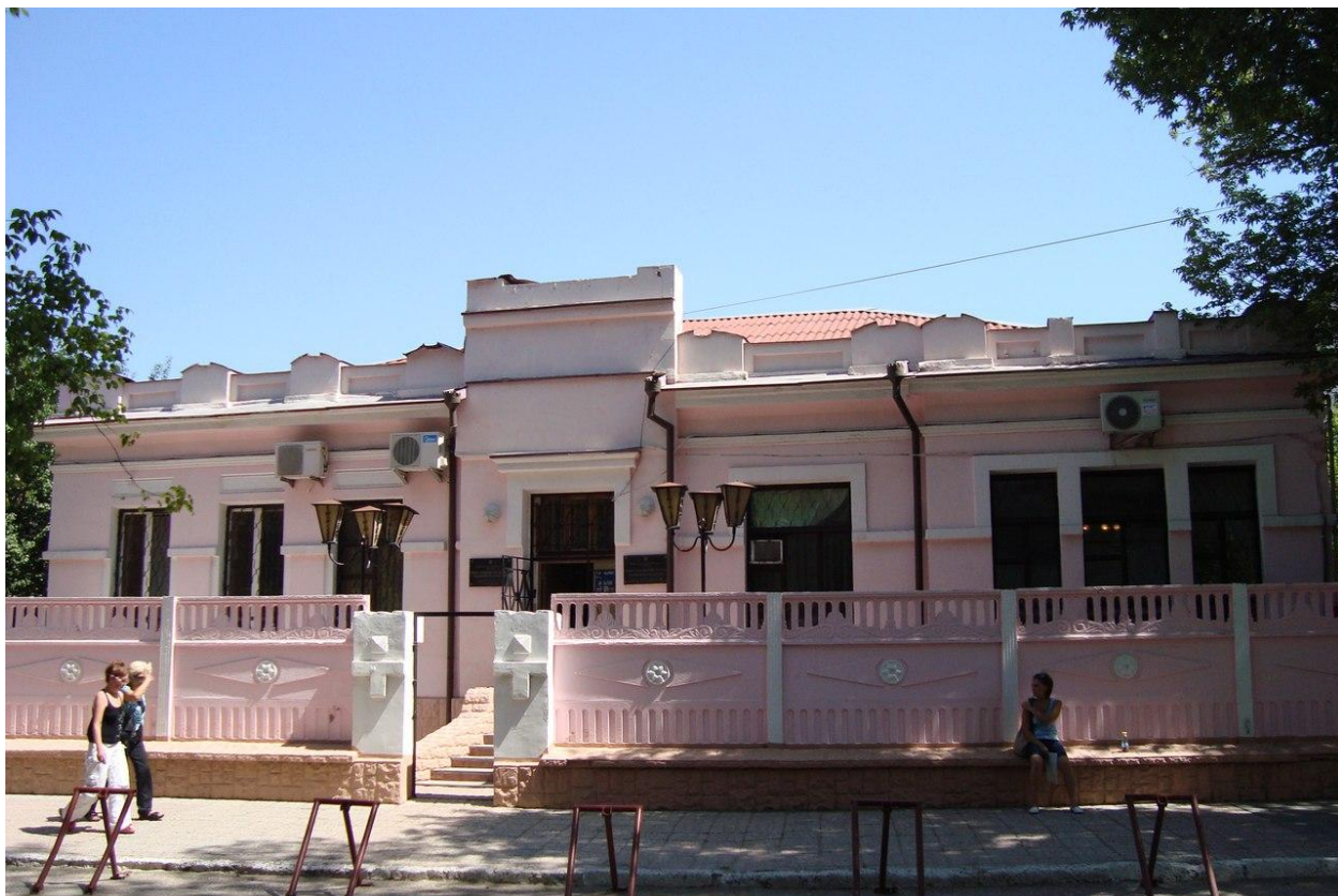
Фото 1. Северный, главный фасад по ул. Тренева, 3а.